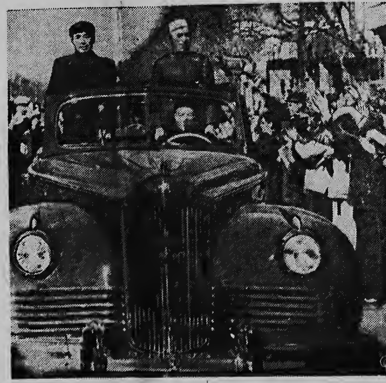
PRIME MINISTER Jawaharlal Nehru of India is cheered by crowds as he is driven through the streets of Peiping, capital of Red China. Standing beside him in the car is Premier Chou En-lai (left) of China. The Indian leader arrived by plane on a state visit.